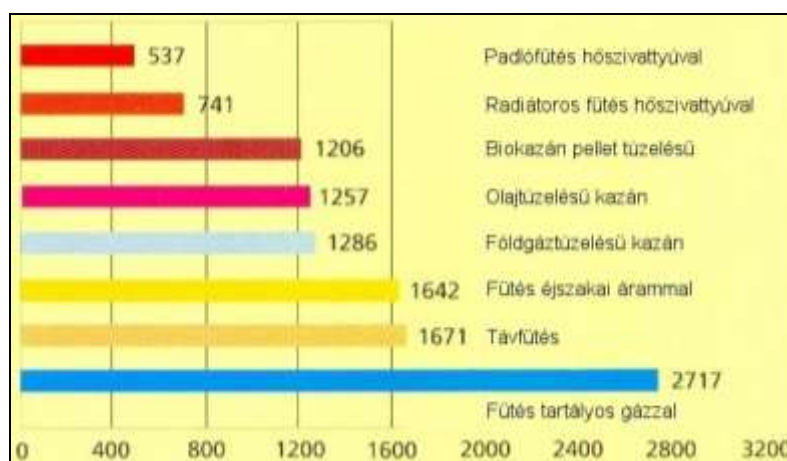
1. ábra. Különböző fűtési megoldások éves üzemeltetési költsége (€) Ausztriában

Az energiaárak piaci emelkedésével egyre inkább előtérbe kerül az energiatakarékosság, illetve az üzemeltetési költség csökkentésére irányuló törekvés. Ez lakóépületeknél elsősorban a fűtési megoldás és a hőtermelő kiválasztásában ad feladatot ( 1. ábra ).